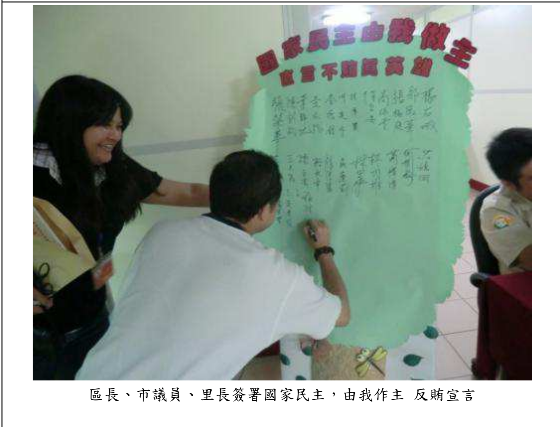
區長、市議員、里長簽署國家民主，由我作主 反賄宣言