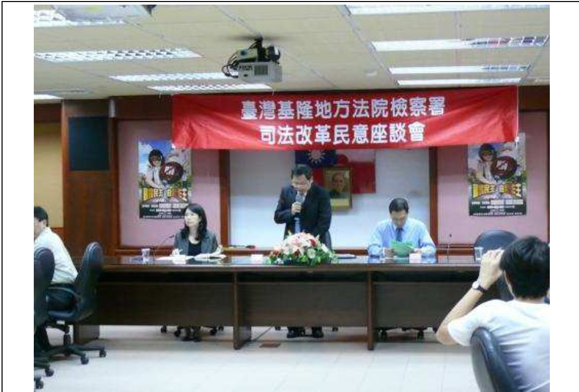
11月29日仁愛區民意座談會