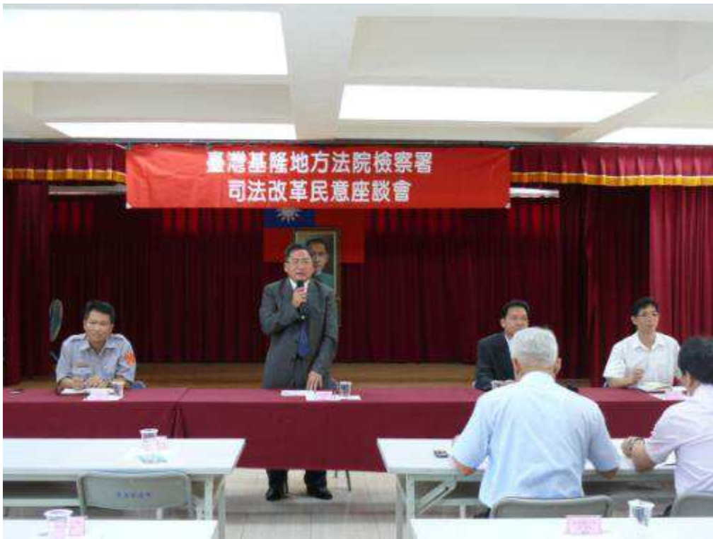
8月2日萬里、金山區民意座談會