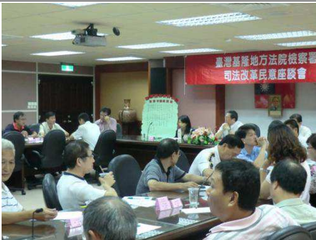
9月28日中山、安樂區民意座談會